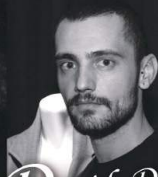
David Delfin 服裝設計

David Delfin 於 1970 年 11 月 2 日出生於西班牙安達盧西亞。他在進入時尚界之前曾是一名畫家，擅長於紙張、帆布和木頭上作畫。2001 年，他與 Postigo 兄弟和模特兒 Bimba Bosé 共同創辦時裝品牌 David Delfin，並與西班牙國家舞團合作。一年後，他在馬德里時裝週展示他的第一個服裝系列。在獲得多個獎項後，2009 年他在紐約時裝週上首次亮相，正式進入國際舞台，並在接下來的四年中連續舉行服裝秀。他也曾以演員和服裝設計師的角色參與電影製作，知名作品包括《Julieta》（2016）、《Los Amantes Pasajeos》（2013）和《La isla interior》（2009）而聞名。2017 年 6 月 3 日他於西班牙馬德里去世。